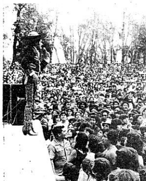
Uno de los momentos más sobresalientes del magno evento.

El día del festival, al caer la noche y ante miles de personas se transmitió en vivo el noticiero "Chimely Dice".