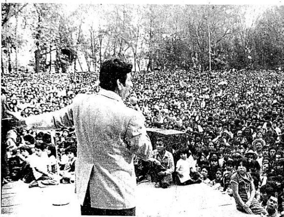
Chimely en uno de los momentos culminantes del evento.