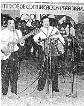
Los Cadetes de Linares levantaron polvo con su gran actuación.