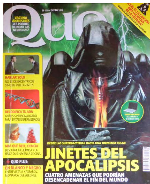
Portada de la revista Quo , no.159, enero 2011

“Profecías 2012 ¿El fin del mundo o el inicio de una nueva era? La verdad sobre las predicciones mayas, en: Muy interesante , enero 2012, no.1, pp. 40-52