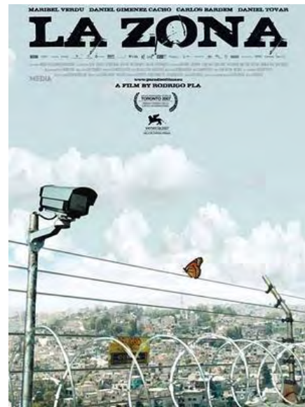
El cartel de la película La Zona

El circo de la mariposa (The Butterfly Circus) , dir. Joshua Weigel (Estados Unidos 2009)