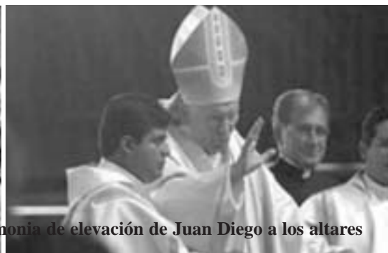
La ceremonia de elevación de Juan Diego a los altares