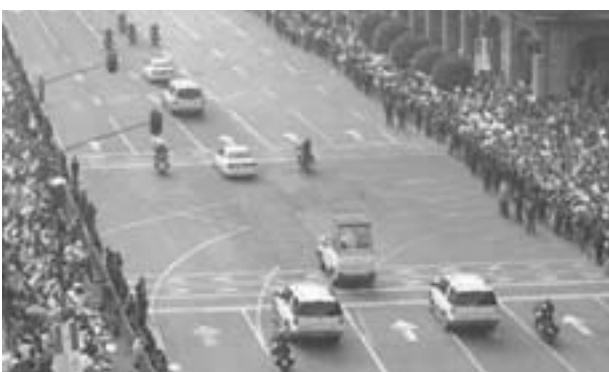
El recorrido papal por las calles de la capital mexicana