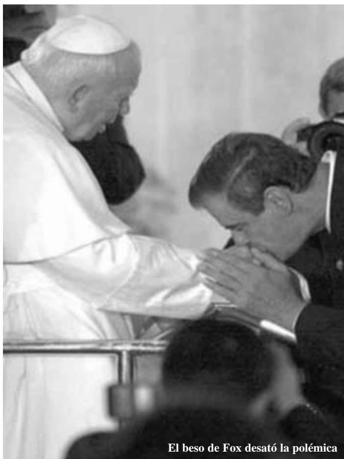
El beso de Fox desató la polémica

Otro aspecto fue el relativo a las discusiones en torno a la imagen de Juan Diego que la Iglesia vendió como propia. Muchas comunidades indígenas protestaron por haber cambiado la imagen del beato indígena, por otra con rasgos europeos. Historiadores, artistas, líderes indígenas, entre