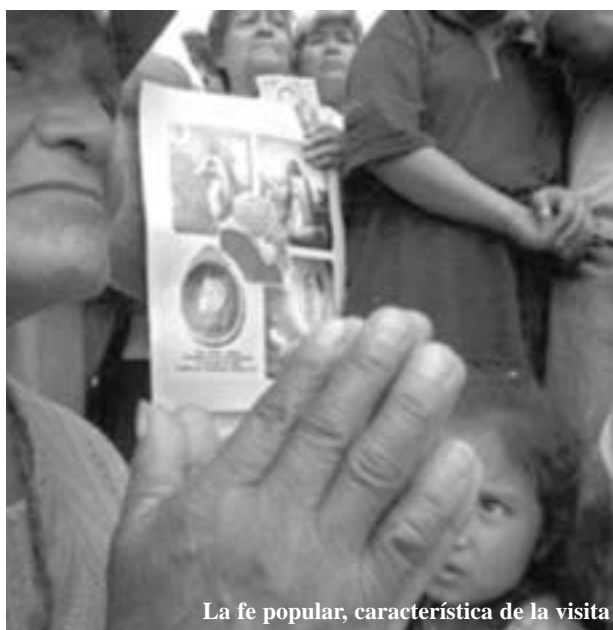
La fe popular, característica de la visita