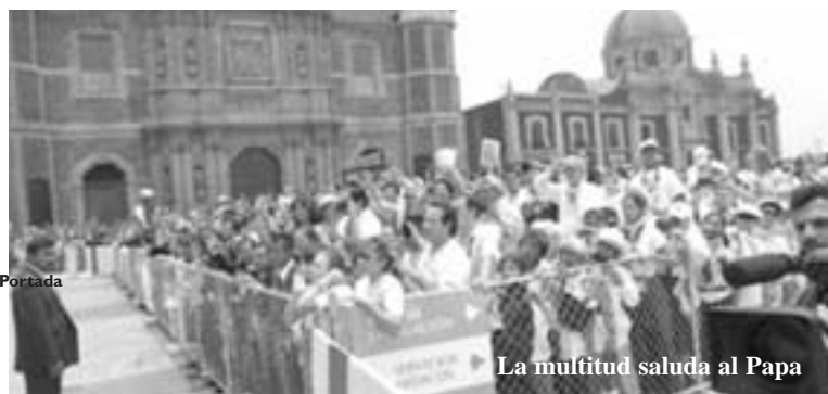
La multitud saluda al Papa

Para esta quinta visita todas estas empresas se abstuvieron del patrocinio directo, limitándose a comprar los espacios publicitarios que las empresas