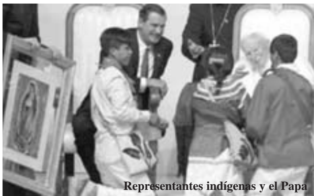
Representantes indígenas y el Papa

Por supuesto que la duda sobre el personaje colocaba en tela de juicio toda la tradición mariana de Guadalupe avalada por la Iglesia. Era decir tanto como que la imagen de Guadalupe era una bonita invención. Esto condujo a que desde tres años antes la canonización de Juan Diego y la posición vaticana se ventilarán desde entonces en los medios de comunicación.