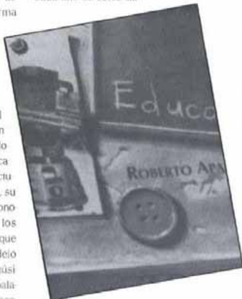
mos es un verdadero ejercicio de producción.

Los materiales están pensados para concretarse en una estructura interna con un movimiento circular teoría-práctica-teoría. A esta estructura responden los fascículos al tejerse, de manera introductoria, alrededor de cada tema y progresivamente avanzar hacia el ejercicio didáctico. Cada uno de éstos últi-