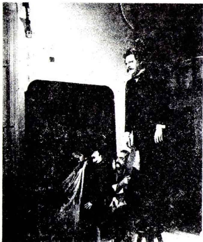
Novedad de la patria, dirigida por Luis de Tavira, representó a representó México en las Olimpiadas Culturales.