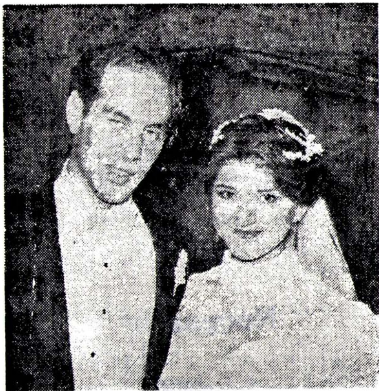
El Rey de Africa y sus hijas en baile de disfraces.