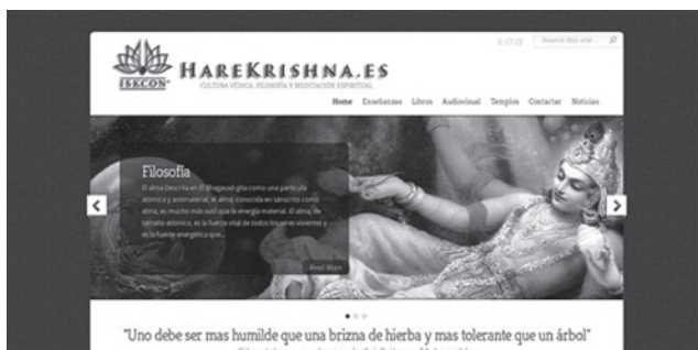
Imagen 1. Página oficial de ISKCON España.

Uno de los hilos más fuertes es producto de la relación del gurú con la imagen de Krishna que resulta en la personalidad de la máxima autoridad: un líder carismático, al que se le debe respeto y veneración similares a la divinidad (Imagen 2). El gurú como figura de poder es sustentado por el sistema védico de la sucesión discipular y se legitima con la transmisión de conocimiento a través de prácticas presenciales (impartir clases, charlas y conferencias), textuales (escribir e interpretar los textos védicos) y rituales (dar iniciaciones, bhakti-yoga ). El liderazgo, en todos los tipos de prácticas (discursivas, no discursivas, materializaciones), es ejercido principalmente a partir de la visualidad con la proliferación de imágenes dedicadas a los maestros espirituales. De ahí se obtienen dos nudos fundamentales: la práctica del bhakti se vuelve inseparable del gurú y de la institución, y la aparición de una estructura vertical entre gurú y devotos, siguiendo un modelo tradicional y conservador.