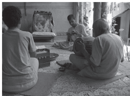
Imagen 3. Canto congregacional.

En las secciones informativas de los sitios Krishna se proponen cuatro principios regulativos que norman la conducta y los valores morales de los individuos: el vegetarianismo, la no intoxicación, la prohibición de la actividad sexual fuera del matrimonio y de los juegos de azar; dando como resultado prácticas como el veganismo –el respeto hacia los animales sensibles mediante el no uso, ni consumo de productos animales (alimentos, ropa, medicinas)– y la negativa a consumir estimulantes, incluso legalizados como el café, el cigarro y el alcohol. El sistema védico, en este sentido, se opone radicalmente a la forma de vida moderna, en la que es generalizada la gratificación de los sentidos sin ninguna restricción. Igualmente, las prácticas Hare Krishna limitan la participación de sus miembros en la esfera social, evitando las topografías urbanas del entretenimiento como bares, antros, cafés, cines, casinos, burdeles, entre otros. Por lo tanto, el sistema védico es inductor de un modelo social diferente al de la norma occidental.