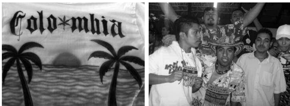
Izquierda: playera comercializada para los jóvenes. Derecha: banda “Los Borrachentos de Reforma”, en el pecho llevan una bandera de Colombia con los nombres de los integrantes. Fotografías: Darío Blanco Arboleda, Monterrey, 2006.

que transgreda dichos parámetros, provoque escándalo e indignación y que sea tratado con desprecio e incredulidad. Ésta es una de las razones por las cuales el vestido es una cuestión de moralidad. Vestir es tan importante que incluso las personas que no están tan preocupadas por su aspecto vestirán de manera adecuada para no sufrir la condena social. De hecho, se habla de la ropa en términos morales: es correcta, está impecable o es vulgar, lujuriosa. Las prendas se convierten en una extensión de nuestro cuerpo, por lo que nos preocupamos constantemente por su estado, por su proyección, ¿cómo se me ve? (Entwistle, 2002: 21-22).