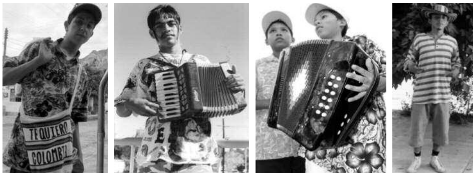
Chavos colombias de Monterrey.

“tropicales” siguen siendo usadas profusamente en la actualidad, ya no se hacen préstamos del rock, sino del hip-hop, con sus pantalones muy anchos (varias tallas más grandes, marca Dickies) y sudaderas igualmente amplias con estampados y aerografiados, en este caso de motivos colombianos . Dejemos que los protagonistas nos relaten: