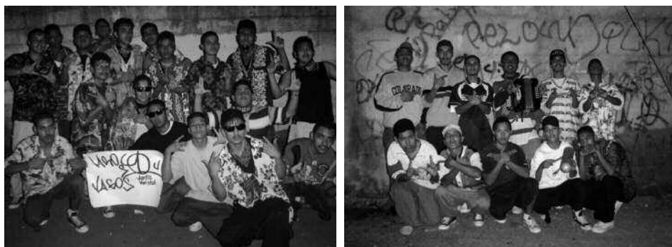
Bandas colombias en Monterrey (2006) Izquierda: “Los Diablitos” de la colonia Arboledas. Derecha: “Los Dickies” de la colonia Nuevo Almaguer.

En Monterrey, a los colombias se les ridiculiza nombrándolos “colombianos” asociándolos así con “los cholos”, quienes tienen vestimentas llamativas y muy mal vistas dentro de la “norma” regia. En esta ciudad, en términos generales, el modelo de vestimenta de la clase media es el “vaquero”: pantalón de mezclilla apretado, camisa a cuadros, botas “tejanas” y, en muchos casos, sombrero del mismo estilo. Cuando se estableció la cultura juvenil colombias , hacia los años ochenta, se crea una estética que les brindará identidad y los diferenciará de la “media” social regiomontana. Con esta nueva estética disruptiva, envían un mensaje de alteridad, de manera asertiva y contestataria, en la lógica que desarrolla Goffman (2001). De su situación marginal y estereotipo, elaboran una resignificación, convirtiéndola en un elemento reivindicativo, “hacen ostentación de su estigma”.