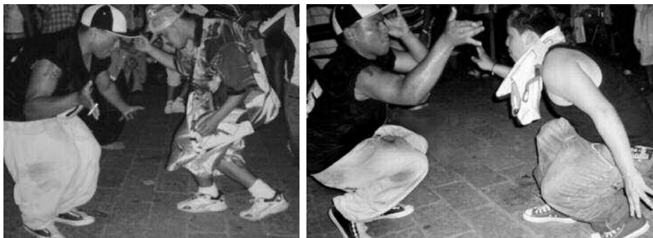
Jóvenes colombias de Monterrey bailando cumbia.

dentro de la estructura de movimientos y manejos del cuerpo permitidos en la sociedad. Dentro de las culturas, es por intermedio de la tecnificación corporal (Mauss) como las estructuras sociales llegan al interior de los individuos; así las demandas sociales se instalan en los cuerpos en movimiento (Islas, 2001).