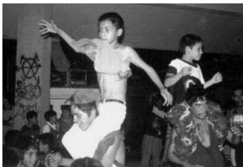
Bailes colombias de cumbia en Monterrey. Derecha: el particular estilo de “La burra”, desarrollado a finales de los ochenta.

1970), lo único que tenían los grupos populares de Monterrey eran discos de acetato, una sonoridad y sus portadas —que les daban mucha información, pero no sobre el baile—. No tenían ningún referente visual de cómo se bailaba esa música. No había vídeos, los grupos colombianos no habían llegado a la ciudad, no existía la Internet; no tenían manera de rastrear el estilo de baile asociado a la música que les encanta. Así, la primera generación de colombias se encuentra con un sonido que les interpela poderosamente el cuerpo, pero no sabían cómo bailarlo. Ocurre una vez más lo lógico, cada quien comienza a bailar como lo siente, como se le ocurre, se inventan pasos. Los pasos más creativos se esparcen rápidamente, se difunden exponencialmente en los bailes y fiestas, llegando a ser conocidos en toda la ciudad. En los años noventa, a un presentador de televisión le llama poderosamente la atención la recursividad, imaginación y cadencia de los bailes populares de su ciudad y se dedica a presentarlos en su programa y a “bautizarlos” con nombres llamativos. Así, aparecen los bailes del “gavilán”, “la motoneta”, “el Fome 30”, 14 “la burra”, como los hermanos conocidos de muchos otros que no tuvieron la fortuna de ser “nombrados” por la televisión.