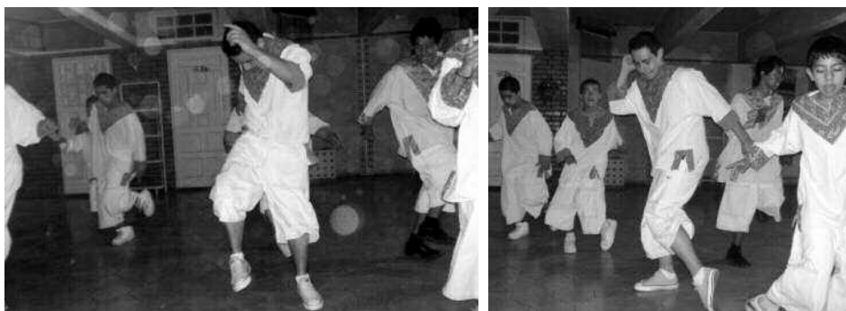
Grupo de baile colombiano “Graffitos Colombia” de Saltillo, Coah., bailando cumbias al muy particular y llamativo estilo de esta ciudad. 18 Fotografías: Darío Blanco Arboleda, 2006.

espacio-tiempo relativamente “regulado” y siguiendo el compás de una música. La diferencia es que en el actual baile de cumbia regio, al estar abiertamente establecido el conflicto entre bandas, la violencia no está regulada, los participantes no controlan el nivel de agresión, ni los golpes están estrictamente enmarcados dentro de la temporalidad de la canción. Así, a muchos de los bailes y conciertos, los jóvenes de las bandas no van tanto a bailar sino a pelear. Sitios como “La Fe Music Hall” 17 o los bailes de barrio se han tomado como un ring de pelea; son espacios para encontrarse a los rivales y “demostrarles” su fuerza para retarlos. En los golpes y en la “valentía” se logra “el reconocimiento” que estos jóvenes buscan más de sus pares. De nuevo la voz de los protagonistas: