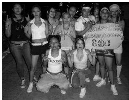
Izquierda: jóvenes colombias en un baile en Guadalupe, Mty. Fotografías: Darío Blanco Arboleda, 2006. Derecha: banda de las cumbiamberas.

En términos generales, los análisis sociológicos no han tomado en cuenta cómo se viste el cuerpo y los significados inmanentes a este proceso. Ataviarse en la vida cotidiana está relacionado con la experiencia de vivir y actuar sobre el cuerpo (Entwistle, 2002: 17). La ropa está en capacidad de comunicar en referencia a la edad, el sexo, la nacionalidad, la relación con el otro sexo, el estatus socioeconómico, la identidad de grupo, el estatus profesional u oficial, el humor, la personalidad, las actitudes, los intereses, los valores. En ciertas ocasiones, la ropa puede ser la mayor fuente de información sobre una persona (Knapp, 1991: 171).