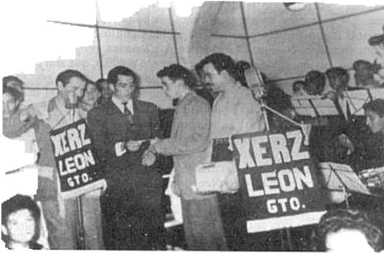
Transmisión en vivo desde el teatro - estudio de la XERZ