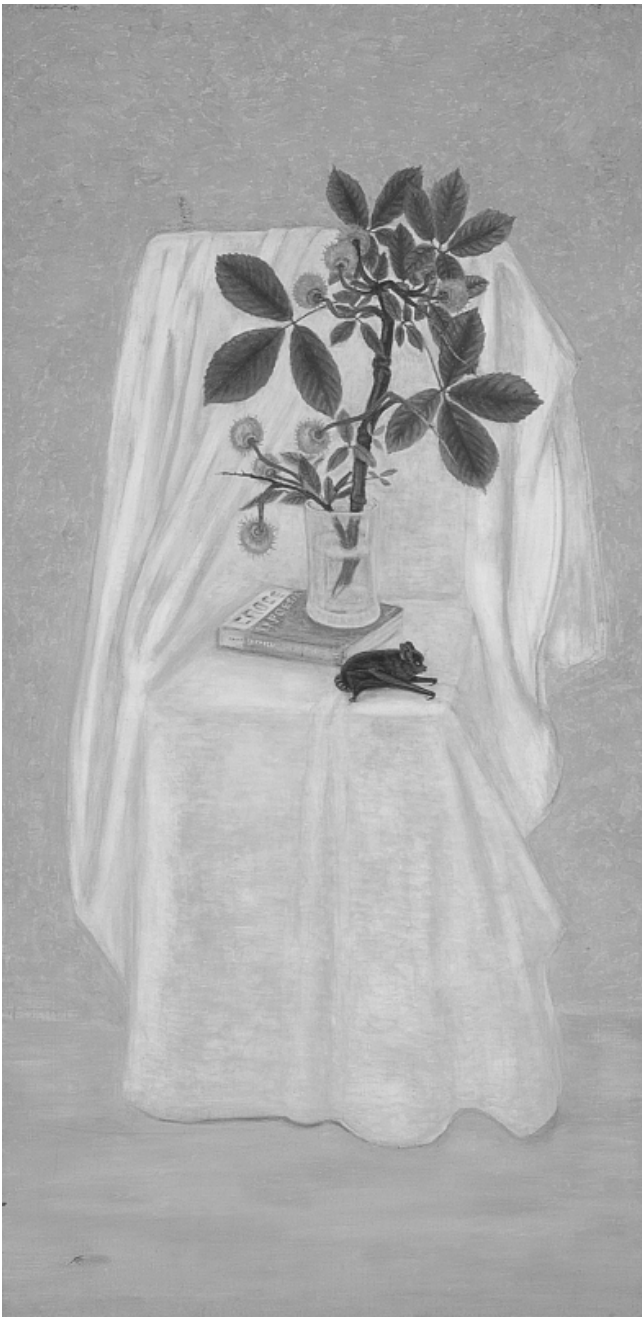
Homenaje a Benedetto Croce, óleo sobre tela, 120 x 60 cm, 1978, colección Fundación Cultural Televisa.

Tematizadas éstas más en términos de determinación causal que de mediación, su estudio fagocitó durante muchos años el sentido de las relaciones entre comunicación y sociedad. Pero hoy ni las figuras de lo social ni los modos de comunicación se dejan tratar tan unificada y totalizadamente, pero necesitamos pensar las estructuras para que la inteligibilidad de lo social no se disuelva en la