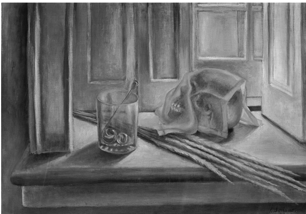
Naturaleza muerta con vaso y calavera, óleo sobre tela, 52 x 72 cm, 1941, colección Marek Keller.

único principio organizador de la sociedad en su conjunto, con el saber tecno-lógico, según el cual, agotado el motor de la lucha de clases, la historia habría encontrado su recambio en los avatares de la información y la comunicación.