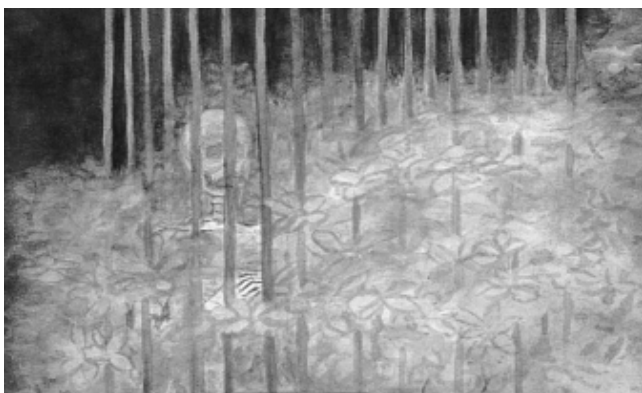
La muerte enjaulada, detalle.

Mediador será entonces el comunicador que se tome en serio esa palabra, pues comunicar —pese a todo lo que afirmen los manuales y los habitantes de la posmodernidad— ha sido y sigue siendo algo más difícil y largo que informar, es hacer posible que unos hombres reconozcan a otros, y ello en doble sentido: les reconozcan el derecho de vivir y pensar diferente, y se reconozcan como hombres en esa diferencia.▲