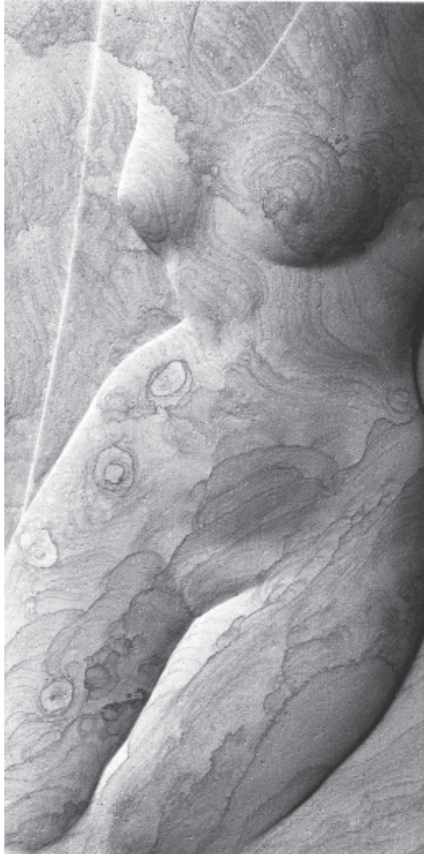
Piedra de Tindaya, Fuerteventura.