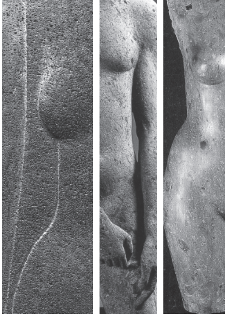
Basalto poroso, Güimar-Tenerife.