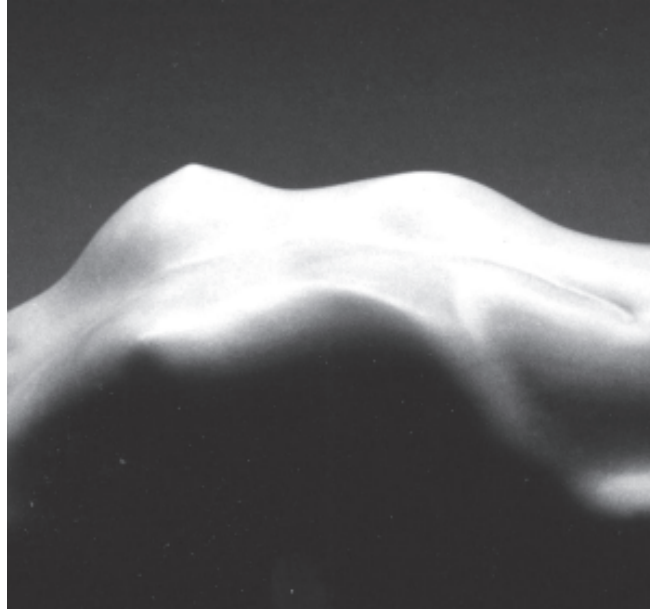
Mármol blanco, Macael-Almería (detalle).