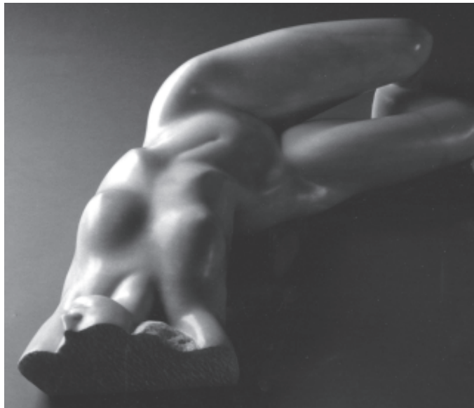
Mármol blanco, Macael-Almería.

Como ya se anotó al inicio del texto, bajo este epígrafe se incluyen exclusivamente obras de la autora en las que la continuidad del volumen y la textura tienen una incidencia muy notable, actuando como elementos básicos para obtener la respuesta emotiva pretendida.