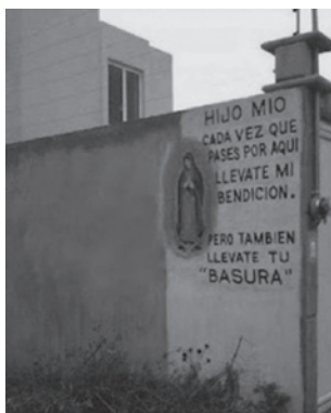
IMAGEN DE LA VIRGEN DE GUADALUPE PINTADA EN PARED DONDE HABÍA UN BASURERO CLANDESTINO