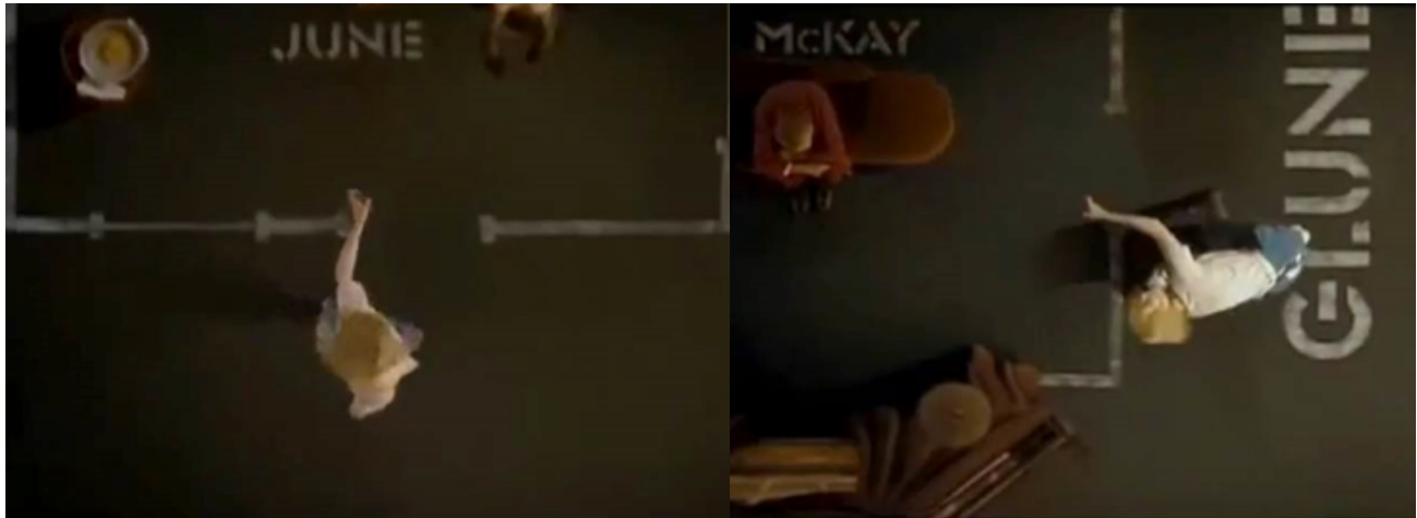
Figura 18. Los personajes de Dogville hacen uso de pantomimas para imitar las acciones del día a día en sus espacios performativos. Aquí se ve cómo Grace asemeja la acción de abrir y cerrar puertas.

Los personajes crean y constituyen espacio performativo por medio de indexaciones simbólicas. Así, en Dogville , los personajes hacen el movimiento de abrir una perilla cada vez que entran a una casa o escuchan ladrar a un perro que se encuentra trazado en el piso. De la misma manera, Julia no sale de la vecindad hasta el último minuto de la película –y sólo cuando es necesario hacerlo– porque la situación simbólica lo amerita.