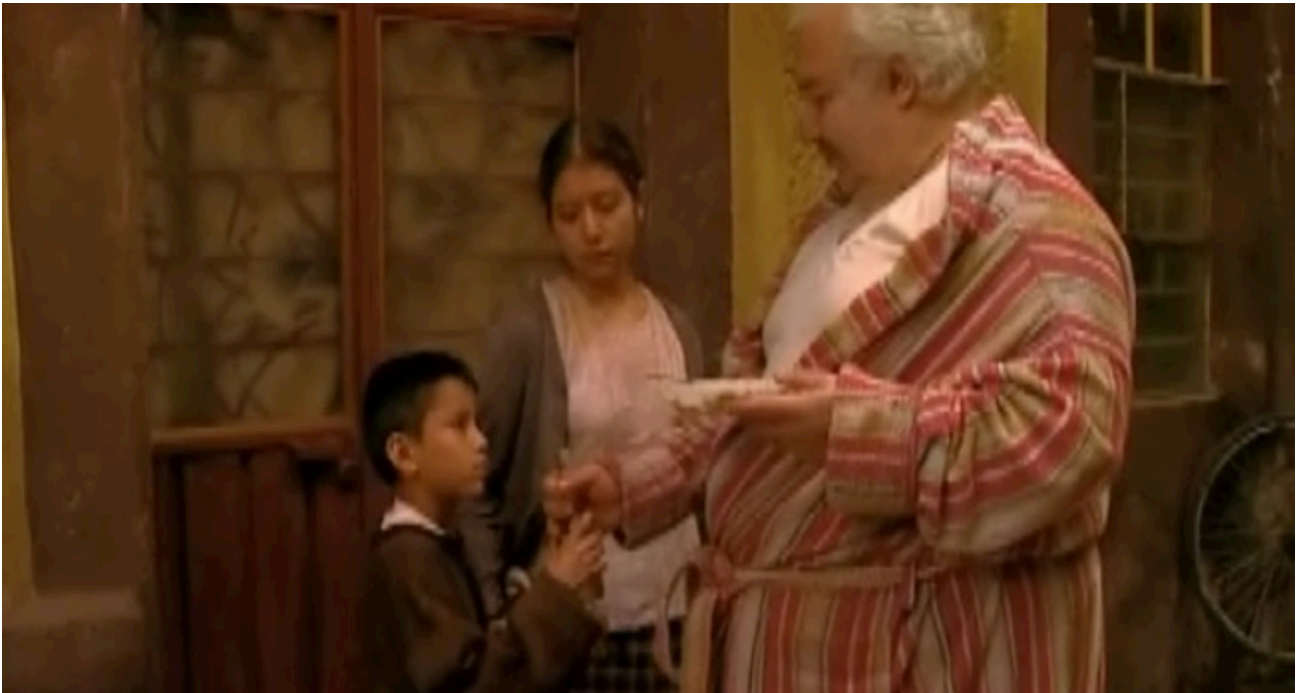
Figura 22. La Marrana decide qué se hace y cómo se vive en los espacios de la vecindad.

Julia , al igual que Grace , es un personaje alienado del contexto en el que se desarrolla. También es afectada –directa e indirectamente– por la competencia dentro del campo de poder. La Marrana es el personaje con mayor capital social dentro del juego y, por tanto, el que decide por la comunidad. Es el portavoz de dicha comunidad.