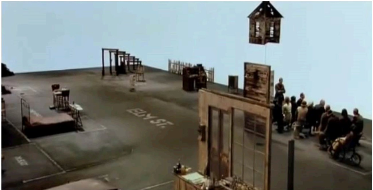
Figura 16. Cada espacio en Dogville es identificado por los nombres que tiene en el piso, por el uso de mínimas estructuras que asemejan una fachada y la distribución de muebles.

Así, es posible identificar la estructura de una casa al ver los cuartos dibujados o el nombre de la familia que habita dicho espacio, mientras que la tienda y la iglesia tienen trazadas ciertas particularidades para identificarlas fácilmente como tales.