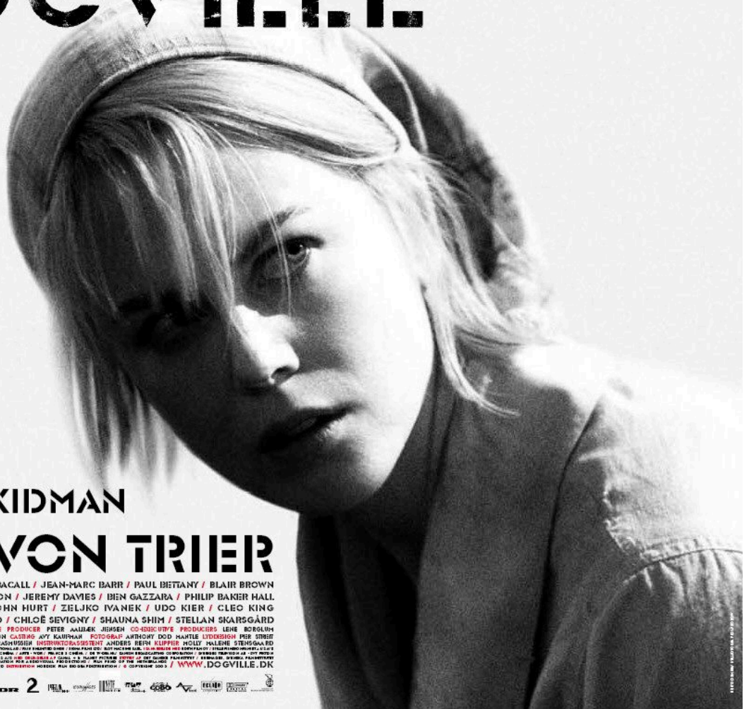
Figura 2. Póster de la película Dogville .