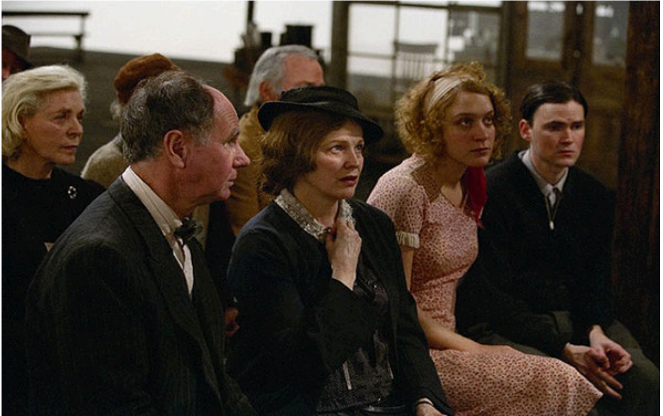
Figura 19. La comunidad de Dogville suele reunirse para tomar las decisiones que podrían –o no– afectar directamente a su pueblo.

El pueblo de Dogville es minúsculo. Cuenta con una iglesia, una tienda de cerámica, un pequeño taller y menos de 10 casas. Los habitantes se distribuyen, equitativamente, entre hombres y mujeres. En su mayoría son adultos y hay muy pocos niños. Los colonos se conocen bien entre sí y, a causa de ello, no existen muchos límites de privacidad entre los individuos. Algo rutinario en sus vidas.