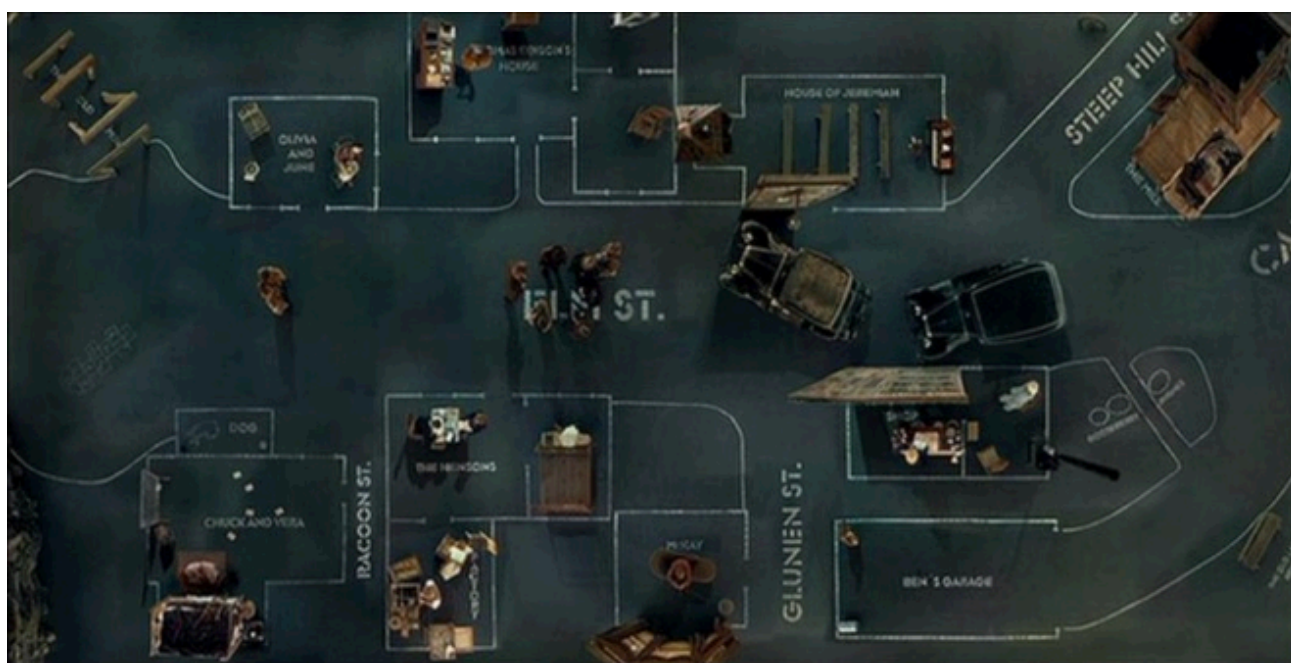
Figura 15. Los habitantes de Dogville se encuentran en una constante circulación en el pueblo. Los hombres usan el espacio público para transporte. Las mujeres lo utilizan como intersección entre una casa y otra.

Esta configuración espacial muestra las labores y movimientos que los personajes realizan. En Dogville , desde la transparencia de los espacios, se pueden observar los trabajos y circulación a los que prácticamente cada individuo pertenece. En Así es la vida el patio es el espacio que une a todas las casas; es el lugar que todos los vecinos tienen que cruzar para entrar o salir de aquellos grandes muros.