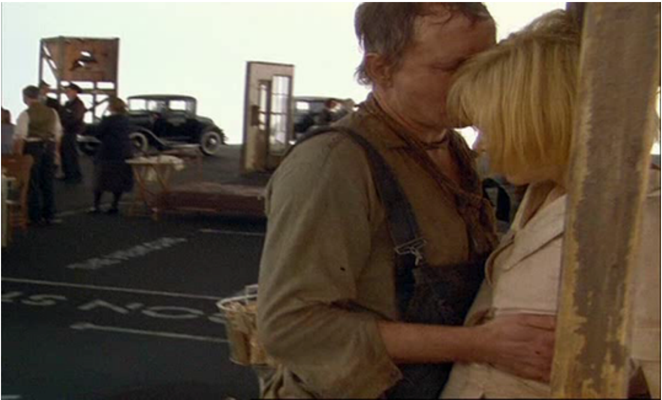
Figura 23. Los hombres comienzan a atentar contra Grace y su cuerpo.

En este diálogo es posible advertir los mecanismos de persuasión y control sobre las decisiones y el cuerpo de Grace . Ella se encuentra atada a la voz de los integrantes de Dogville . De ellos depende si la policía se entera que se encuentra escondida con ellos.