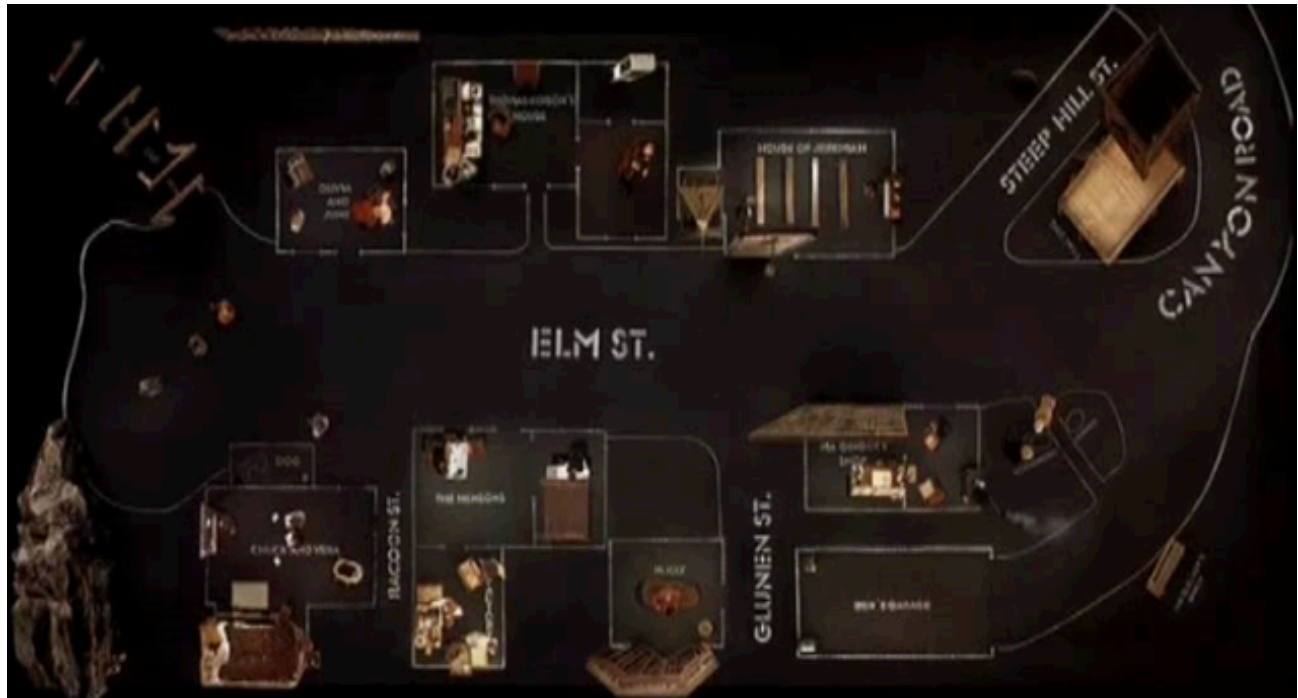
Figura 12. Distribución de las casas en el pueblo de Dogville por medio de una herramienta teatral donde los límites de cada hogar son dibujados en el piso de un escenario.

edificios que conforman dicha población. Estas se encuentran divididas por una enorme avenida principal que cruza las pocas “viviendas” del lugar. Cada hogar tiene escrito, en su interior, el nombre de las personas (o familias) que las conforman.