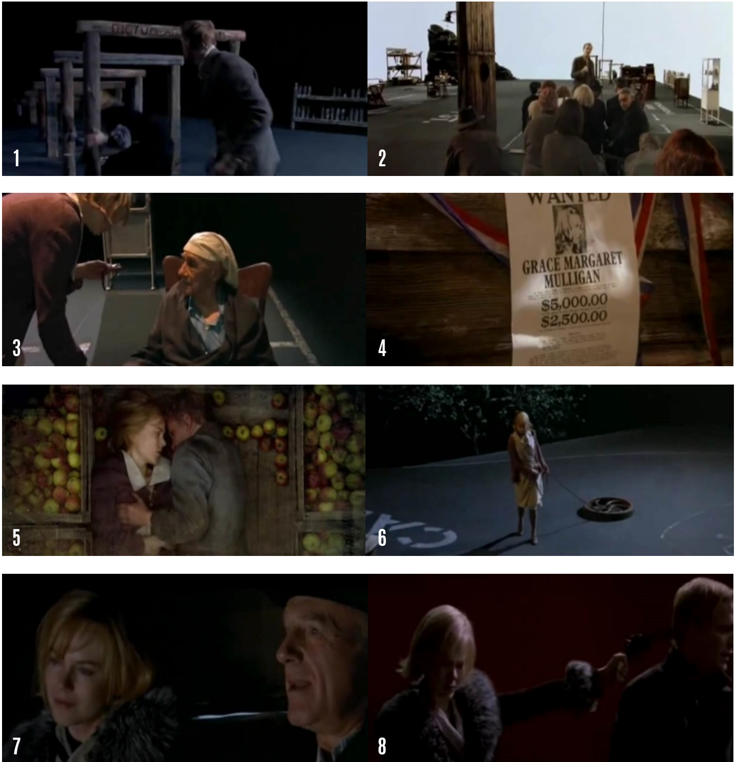
Figura 9. Fotograma 1: Tom oculta a Grace , en Dogville , de los mafiosos que la persiguen. Fotograma 2: Tom convence al pueblo de Dogville que Grace se quede con ellos. Fotograma 3: Grace le regresa el favor al pueblo dedicando su tiempo a atender a la comunidad. Fotograma 4: La policía pone una recompensa por encontrar a Grace . Fotograma 5: Los habitantes de Dogville , al estar resguardando a una fugitiva, se aprovechan de Grace a cambio de su estancia en el pueblo. Fotograma 6: Grace intenta escapar y la encadenan a un cacharro viejo. Fotograma 7: El papá de Grace es el líder de la mafia y le pide que regrese con él. Fotograma 8: La mafia destruye a Dogville y Grace mata a Tom .