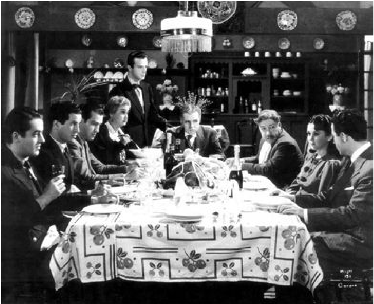
Figura 3. Escena de la película Cuando los hijos se van (1957). Se muestra la representación de la madre abnegada en la actriz Sara García (lado izquierdo superior).

resignación-bondad-sacrificio, sufre algunas alteraciones y modificaciones, que no vendrían a resignificarlo sustancialmente sino sólo a ajustar temporalidades y contextos (Torres, 2001: 87). En ese sentido, la tipificación de la madre se edifica en diferentes niveles y capas de personificación de la figura femenina y en diversas extensiones de sí misma: en la hermana y la esposa.