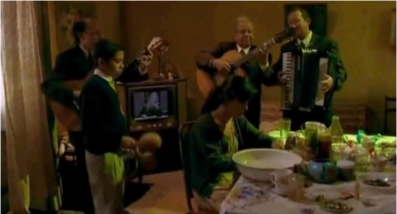
Figura 24. El trío de hombres le cantan a la protagonista cuando sus sentimientos por Nicolás están a flor de piel.

Anselmo y sus muchachos le cantan a Julia de amor y de desamor, de las consecuencias de enamorarse de un hombre que –según el trío– “llega y engaña”, de los errores que ella cometió y de los que no puede deshacerse de ellos. Este coro pasa a ser el epítome simbólico de la relación de poder entre Julia y Nicolás y lo ejemplifican de la mejor forma: re-presentando –en palabras del coro musical– a la “hembra que no pensó con razón”.