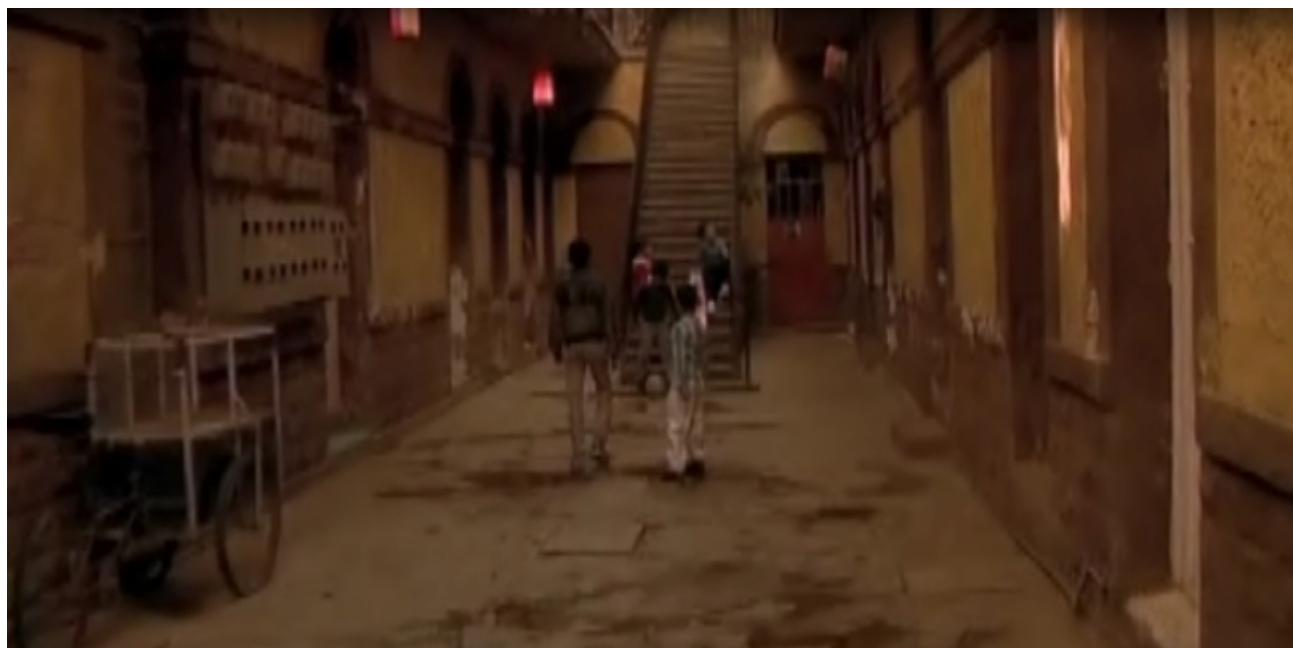
Figura 13. El patio es el único lugar público visible en la película. De manera que ahí se realizan las reuniones comunitarias y la circulación de los habitantes de la vecindad.

negocio de medicina informal del otro lado del patio, muy cerca de la entrada. Según la narrativa de la película, no se sabe de su existencia hasta cerca de la mitad del filme.