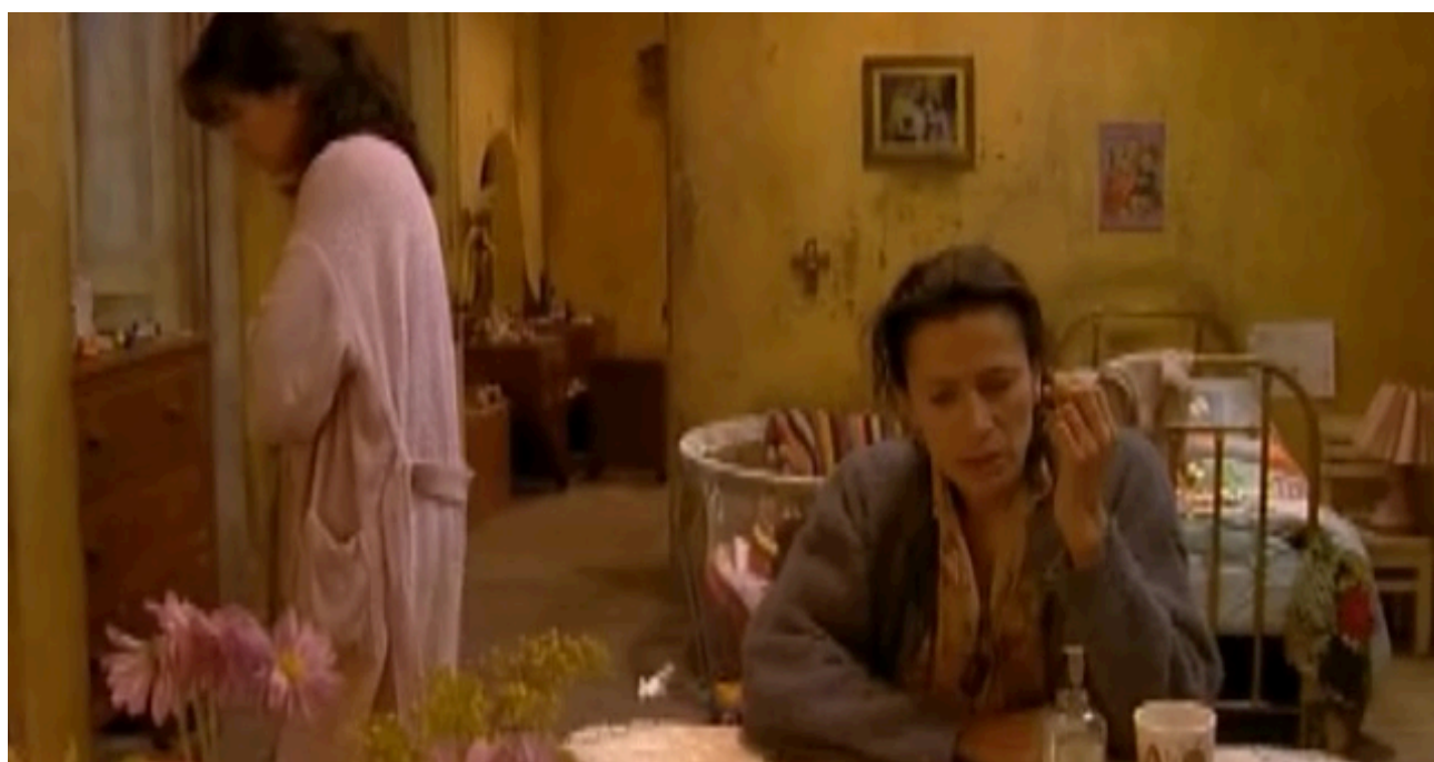
Figura 14. La sala de la casa de Julia es donde sucede la mayor parte de la historia. En ella se pasea desesperada, cuida a sus hijos y discute con Nicolás .

Como se ha intentado argumentar, dicha enmarcación es también resultado de la configuración y transfiguración de esquemas perceptivos en las relaciones de poder entre personajes. De forma que, tanto Grace como Julia , perpetúan los acuerdos hechos en sus contratos sociales al momento de participar en cada relación. Julia con su esposo y Grace con el portavoz de la comunidad de Dogville . En el siguiente esquema podemos ver la reacción de dichos personajes ante la limitación del espacio.