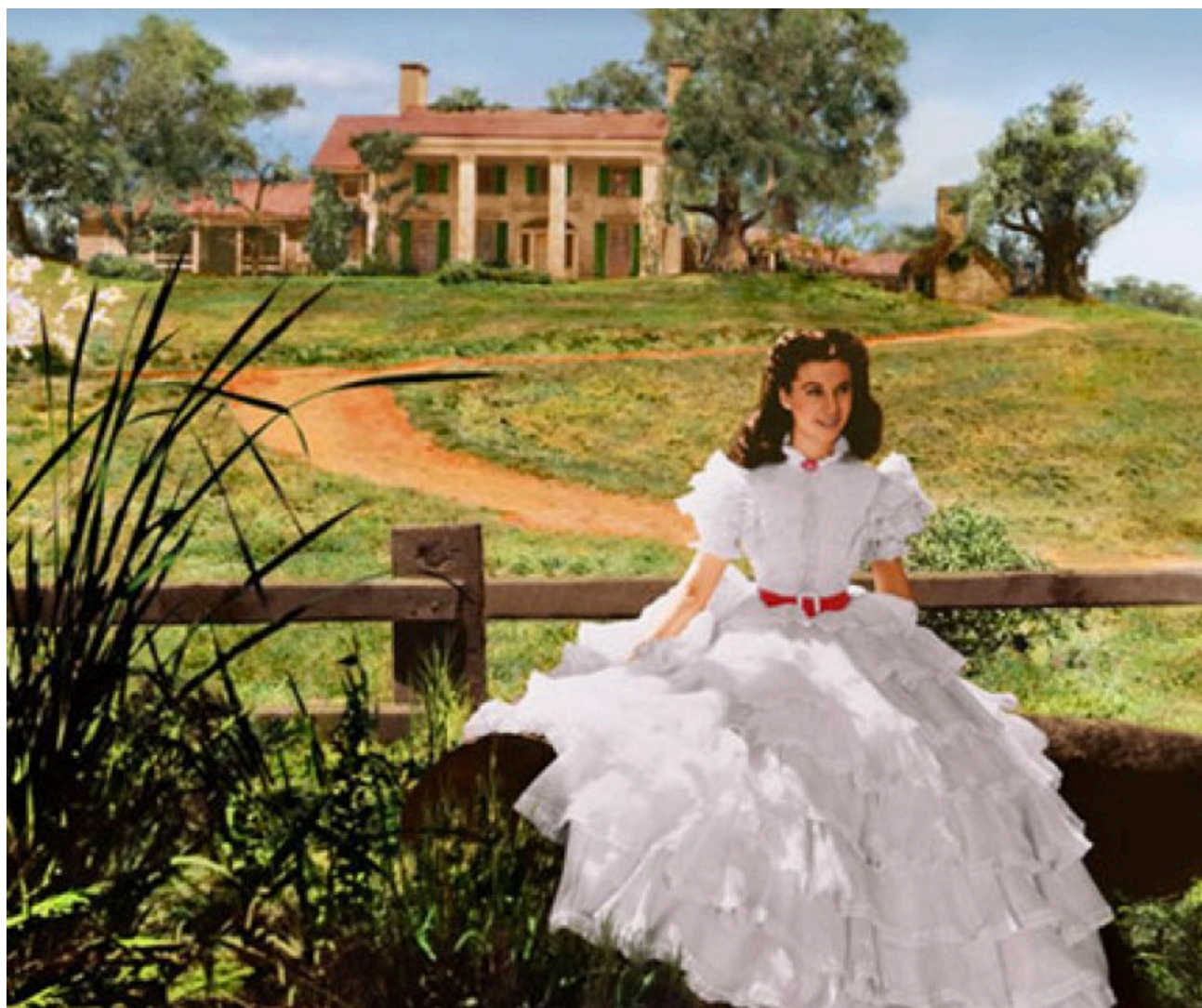
Figura 4. La actriz Vivien Leigh en una escena de la película Gone With The Wind (1939). La representación de la Southern Belle frente a las tierras heredadas por su padre.

Esta figura femenina generalmente es heredera de ricos terratenientes y representa la feminidad del suelo meridional que reverencia la ley del patriarca, y protege la tierra que su padre le enseñó a amar (Bou, 2006: 20). Sus motivos son recurrentemente provenientes de la figura patriarcal y del legado o las instrucciones que él le dejó cuando ya no estuviera presente.