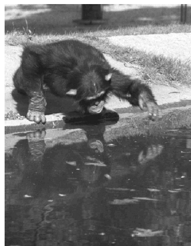
Chimpancé joven jugando con su reflejo (De Waal y otros, 2005: 11141).

Recuerdo todavía la casa de mi abuela en Colima, cuando de muy pequeño, a principios de los años sesenta, veía coexistir dos tecnologías para iluminar la casa: una, muy lejana de mi experiencia en la Ciudad de México, con quinqués de petróleo que