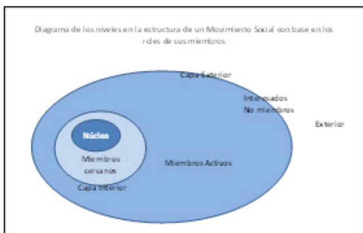
Diagrama 1. Niveles en la estructura de un movimiento social con base en los roles de sus miembros.

Exterior. El exterior es la sociedad en su conjunto, abarcando toda la gama de personas, organizaciones e instituciones, donde se maneja la política, los imaginativos, donde se le da interpretación a la información que sale del movimiento y donde tienen repercusiones y consecuencias las acciones del movimiento.