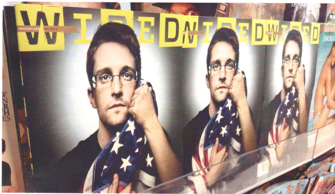
Edward Snowden puso el tema de la privacidad en la discusión internacional..