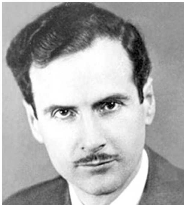
McLuhan en la primera etapa de su vida profesional

Un total de nueve universidades le concedieron doctorados honoris causa : University of Windsor (1965), Assumption University (1966), University of Manitota (1967), Simon Fraser University (1967), Grinnell University (1967), St. John Fisher College (1969), University of Alberta (1971), University of Western Ontario (1972), University of Toronto (1977).