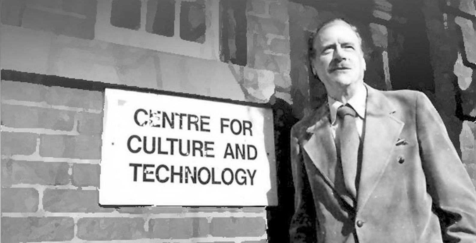
McLuhan se desempeñó como director del Programa de Cultura y Tecnología de la Universidad de Toronto