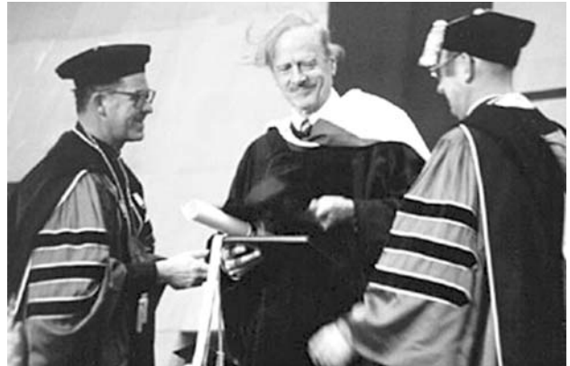
Sus primeros lauros académicos

Cada nuevo medio de comunicación transforma la forma como creamos y nos comunicamos, modificando también al sistema de medios de comunicación que operan en el ambiente cultural vigente