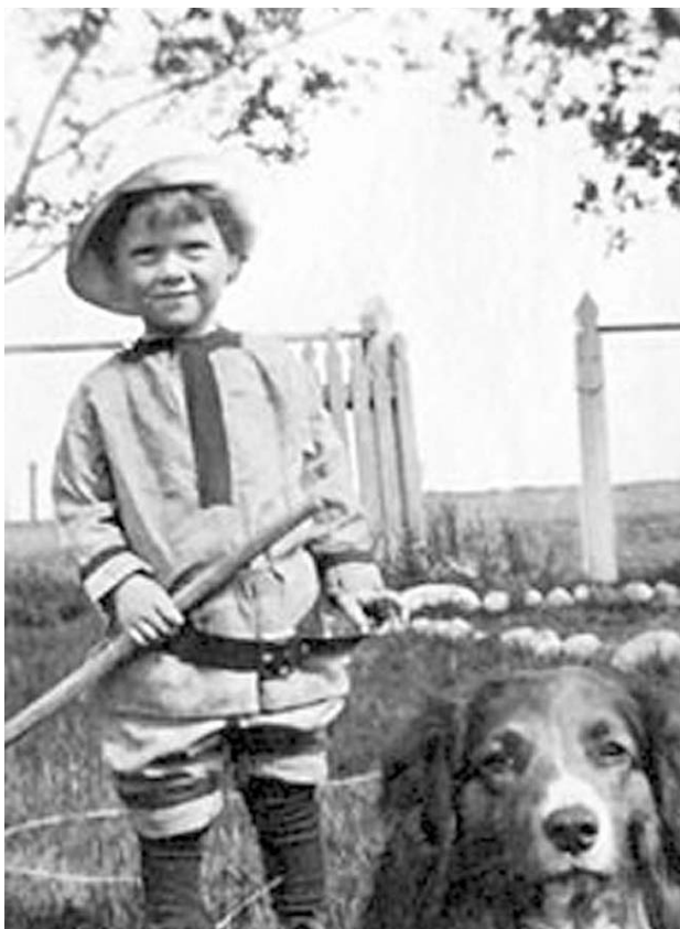
Niño aún en Alberta, Canadá