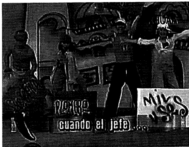
"Cuando el jefe ... llama para despedirte." Picardía Mexicana representa una escena donde cerca de la Catedral Metropolitana de la Ciudad de México, trabajadores desempleados sostienen las pancartas de sus asociaciones