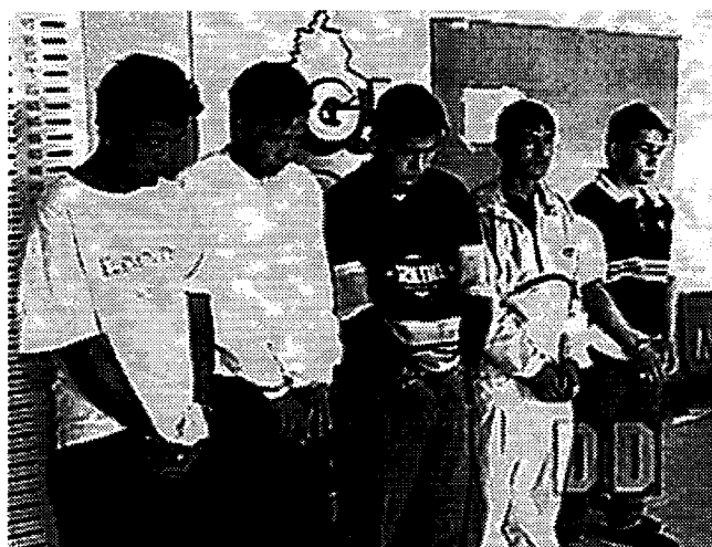
Sospechosos son capturados ante las Cámaras de Duro y Directo