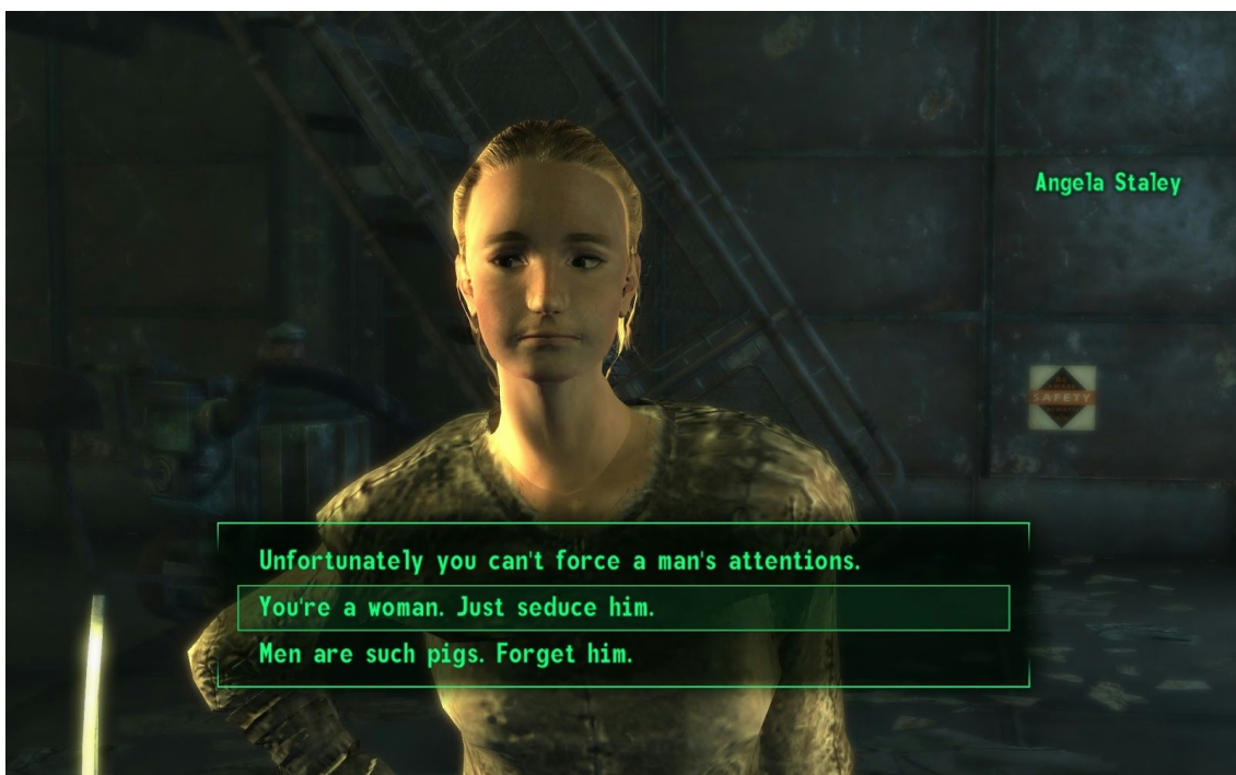
Ejemplo de interacción con los personajes en el juego FallOut 3.